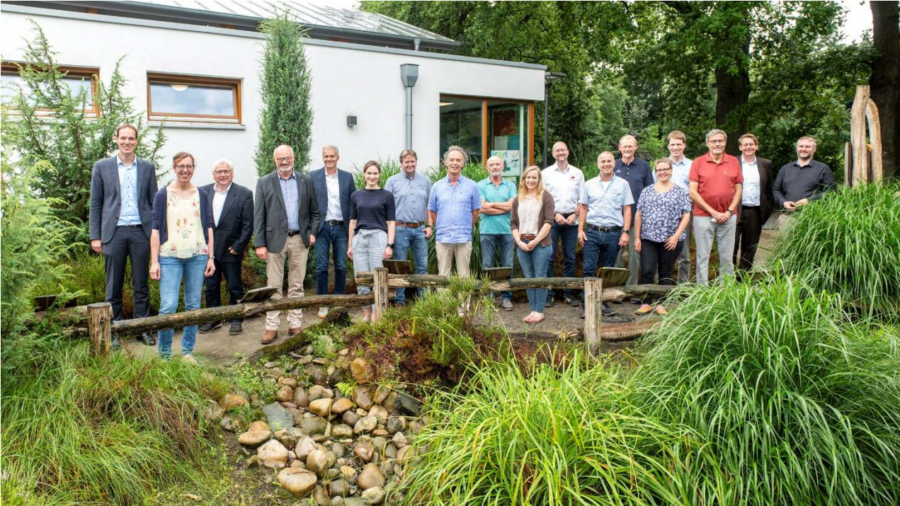
Gründungsmitglieder der Ökologischen Station „Grafschaft Bentheim/Emsland-Süd“ (ÖGE), Foto: Franz Frieling